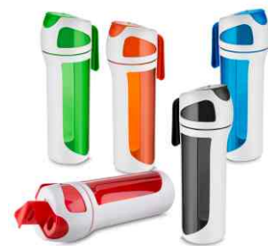
1087 - 550 ml Duo