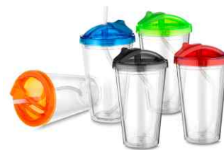
1090 - 470ml copo térmico