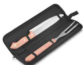
1091 - Estojo kit churrasco