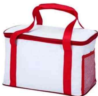
1052 - Bolsa 15L