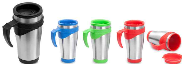
1088 - caneca 450ml