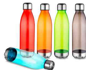
1083 - 750ml mini Pet