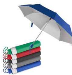
1092 - Guarda Chuva