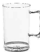
1089 - caneco Chopp 400ml