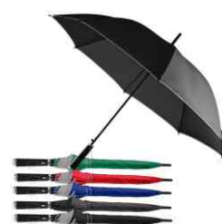
1093 - Guarda Chuva Boss