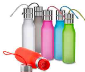
1082 - 600ml emborrachada