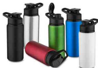
1085 - 600ml alumínio