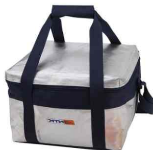
1051 - Bolsa 12L