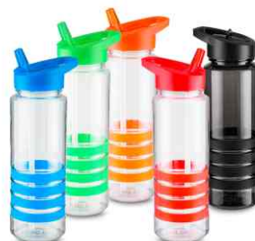
1086 - 700ml grip