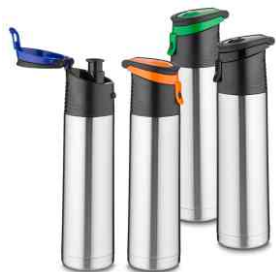
1084 - 500ml inox inquebrável