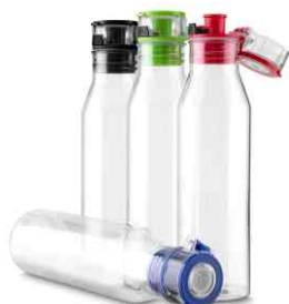
1081 - 700ml com alça