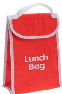
1050 - Bolsa Fit 4,5L