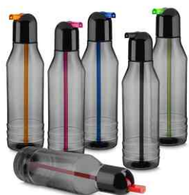
1080 - 600ml canudo